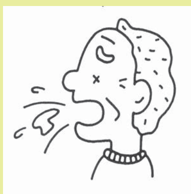
むせや痰の量が多い