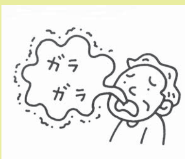
ガラガラ声が多い