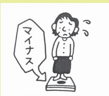
体重の減少（栄養不良）