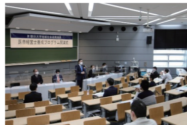
開講式・初回講義 (朝日大学穂積キャンパス講義室)